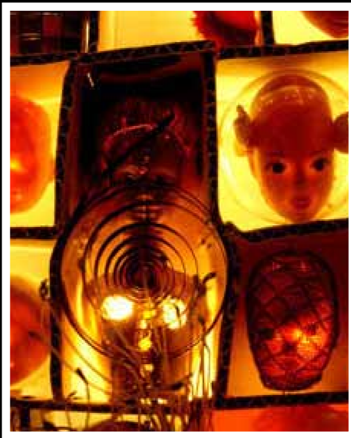
Voyage au coeur d'une Icone Mondiale