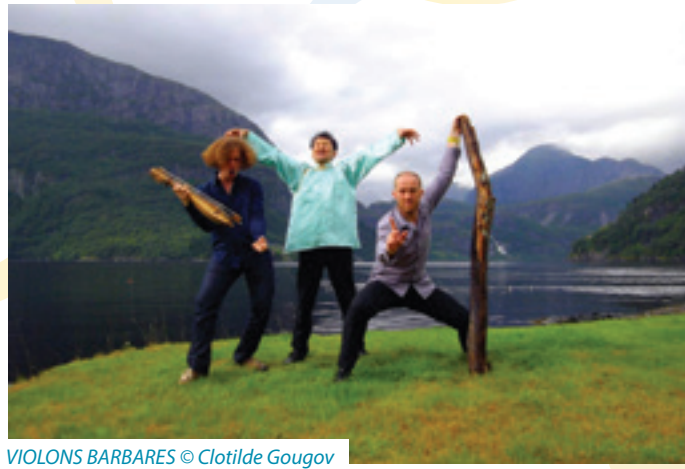
VIOLONS BARBARES © Clotilde Gougov

mer. 9 juillet BRAM (11) / Le Port Rencontre-débat