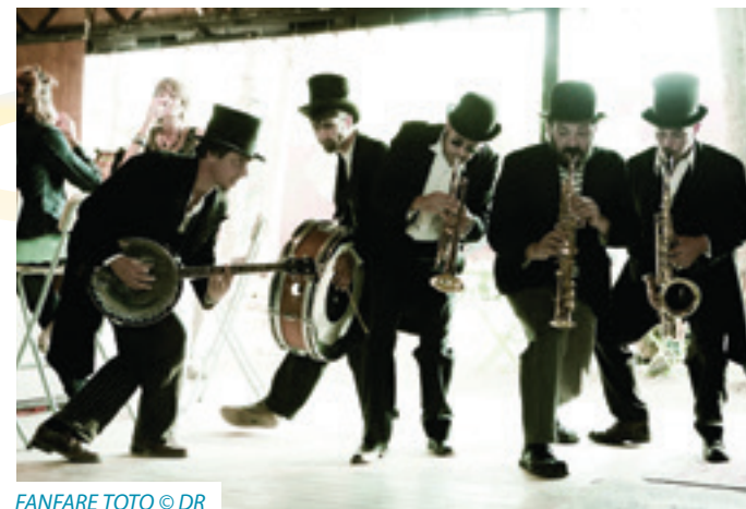
FANFARE TOTO