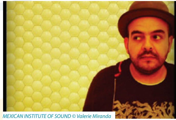
MEXICAN INSTITUTE OF SOUND