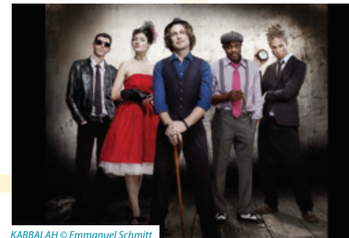
KABBALAH © Emmanuel Schmitt

jeu. 26 juin MONTGISCARD (31) / L'Écluse + Randonnée