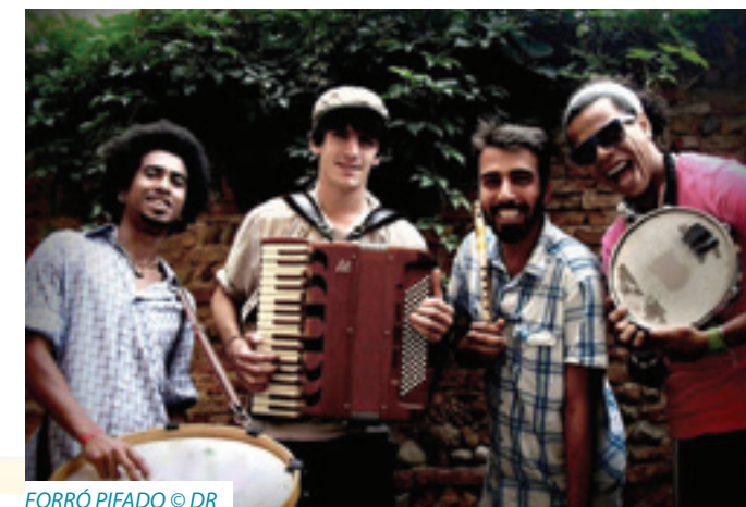
FORRÓ PIFADO