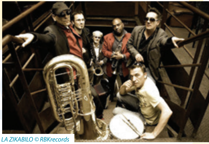
LA ZIKABILO