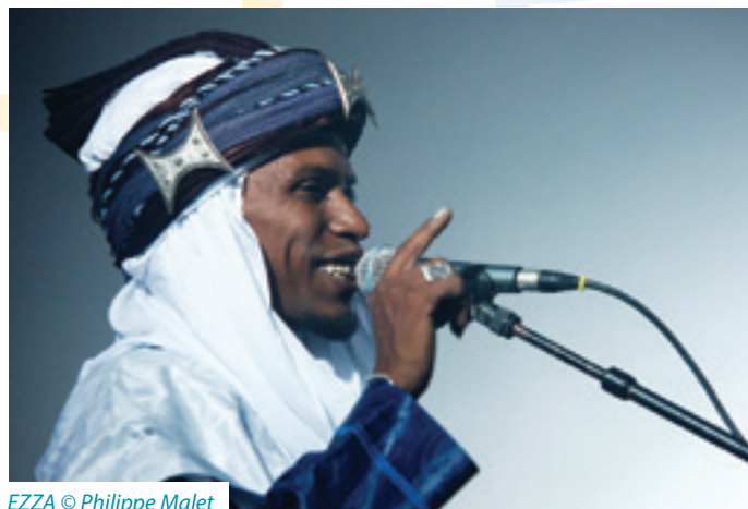
EZZA © Philippe Malet