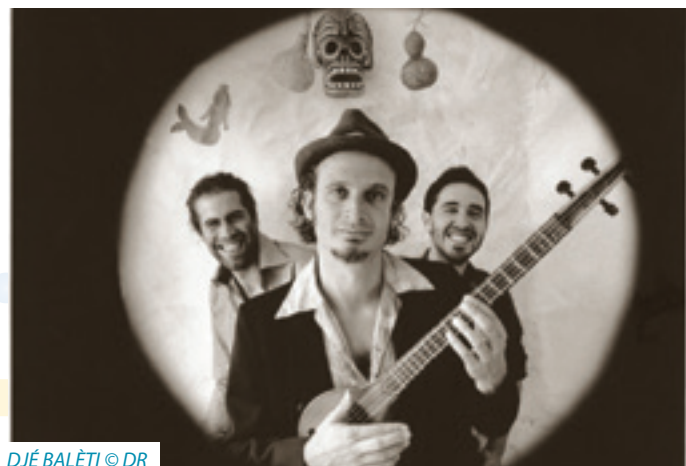
DJÉ BALÈTI