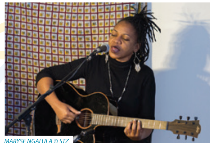
MARYSE NGALULA © STZ