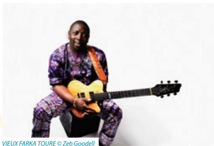
VIEX FARKA TOURE