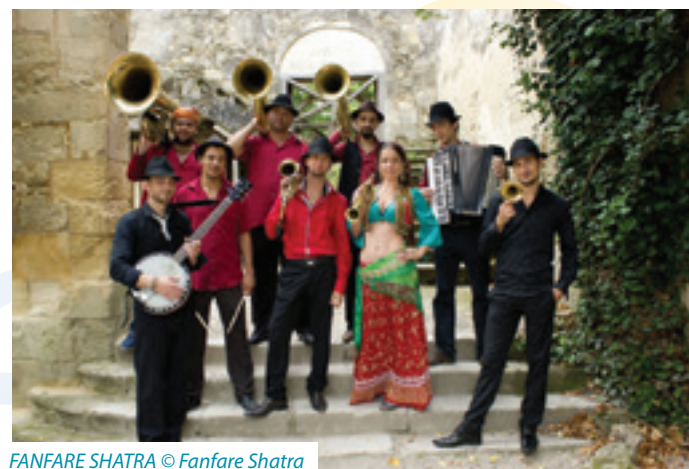
FANFARA SHATRA