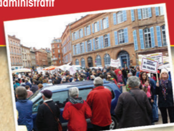
en chemin vers la préfecture nov. 2013

MANIF DES OPPOSANTS RECOURS AU TRIBUNAL administratif